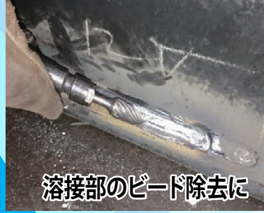
溶接部のビード除去に