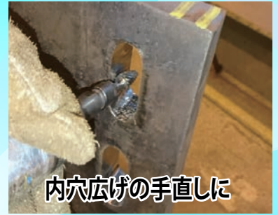
内穴広げの手直しに