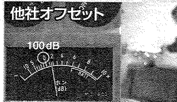
騒音値目安：90dB→パチンコ店内、100dB→電車のガード下

主な用途 一般鋼、高張力鋼・ステンレス鋼・アルミなどのバリ取り、ビード取り、面取り、開先取り、表面研削などハードな研削作業